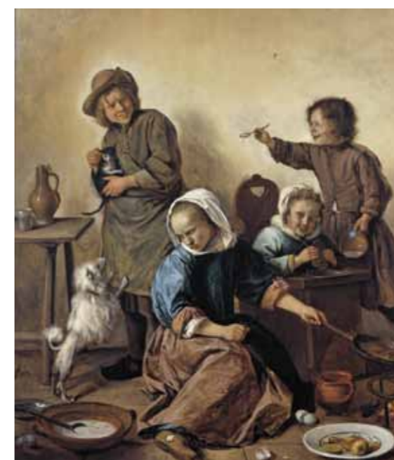
Jan Steen (Leiden 1626 – 1679) Børnenes måltid , ca. 1665 Olie på træ. Erhvervet 1904

Tak til Danish Crafts HAY Statens værksteder for Kunst egecarpets.com Snedker Per Sjöström, Sverige JM Rør Tünke H. Holmer