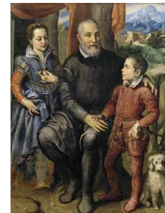
Sofonisba Anguissola (Cremona ca. 1535 – Palermo 1625) Portrætgruppe med kunstnerens fader Amilcare Anguissola og hendes søskende Minerva og Astrubale , ca. 1559 Olie på lærred. Erhvervet 1873