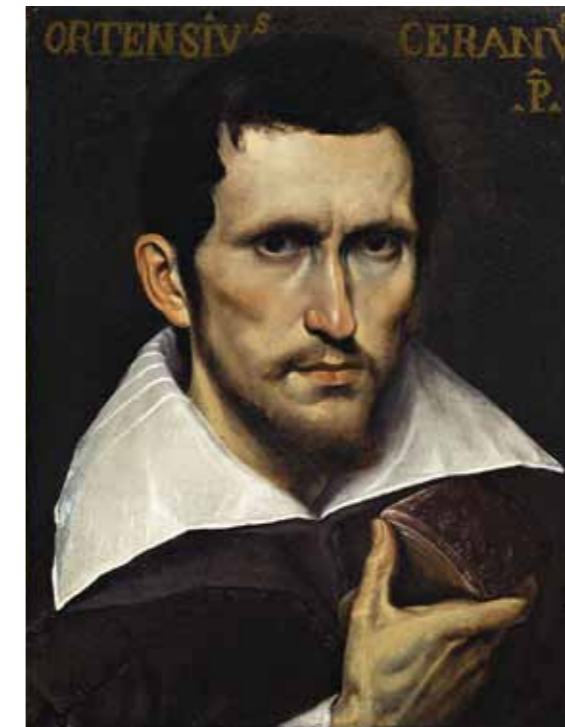
Ortensio Crespi (Cerano 1577 – 1620) Selvportræt, u.å. Olie på lærred. Erhvervet 1913