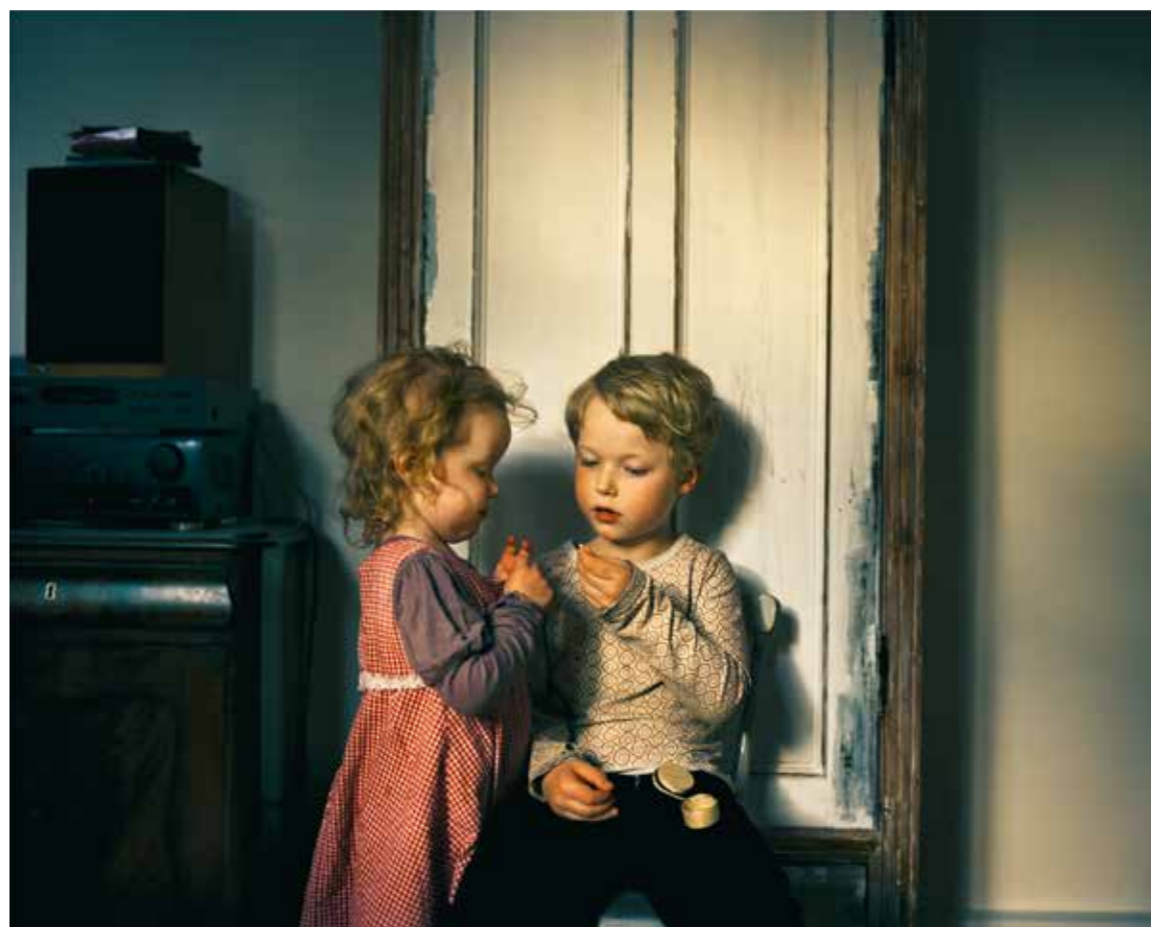
JOAKIM ESKILDSEN Tanden , 2012. Joakim Eskildsen/Gallery Taik Persons

Hun er internationalt anerkendt for sine stofflige og sensuelle billeder og er repræsenteret i utallige samlinger i ind- og udland. I 2008 blev Kurtzweil tildelt Statens Kunstfonds livsvarige ydelse.