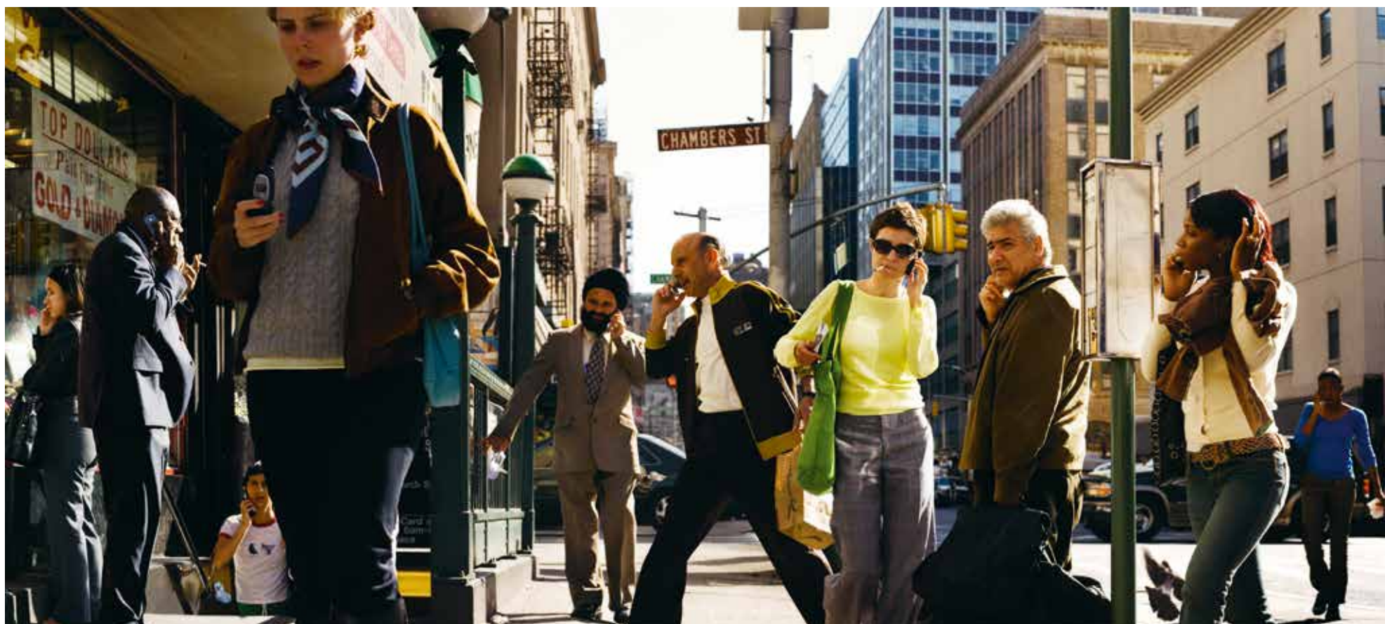
PETER FUNCH Communicating community, 2007 V1 Gallery