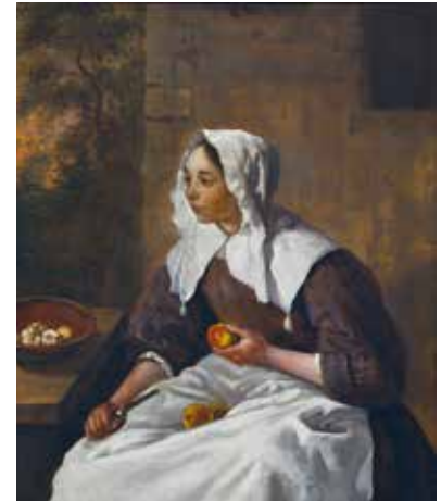
Gabriel Metsu, En pige, der skræller æbler , u.å. Nivaagaards Malerisamling

åbner museet med sang og fællessang. Gratis for årskortholdere eller når entreen er betalt