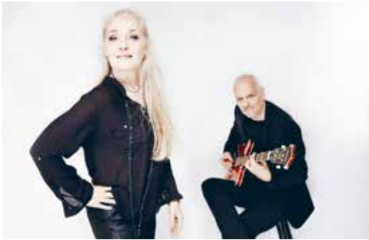
Cæcilie Norby og Lars Danielsson