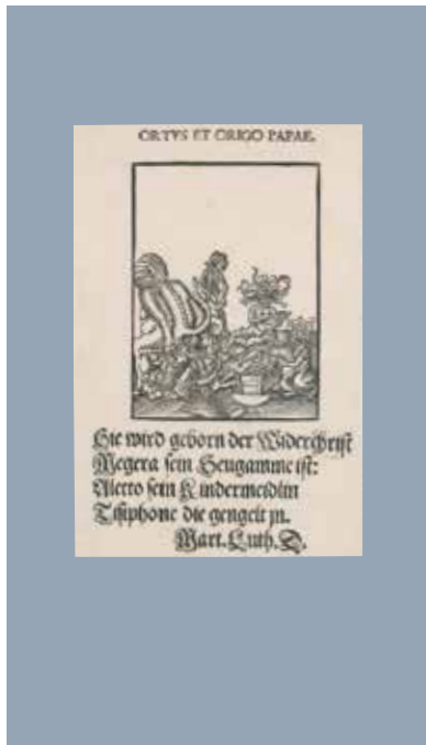
Eksempel på satiretegnning fra Reformationens tid