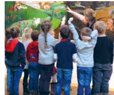
Efterårsferien byder på forskellige aktiviteter for børn

åbner museet med sang og fællessang. Gratis for årskortholdere eller når entreen er betalt