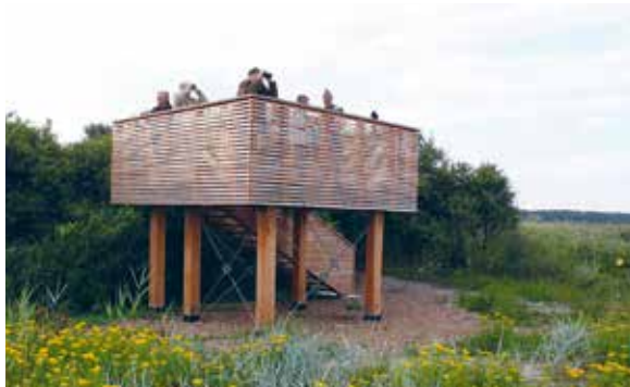
Fugletårnet ved Strandengene besøges på guidede fugleture.