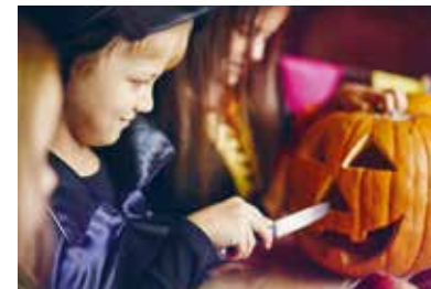
Halloween på museet

Begrænset antal pladser. Pris 100 kr. Halv pris for årskortholdere