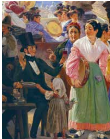
Wilhelm Marstrand, Romerske borgere forsamlet til lystighed i et osteri, 1839 (udsnit) . Nivaagaards Malerisamling

Omvisningen er gratis for årskortholdere eller når entreen er betalt