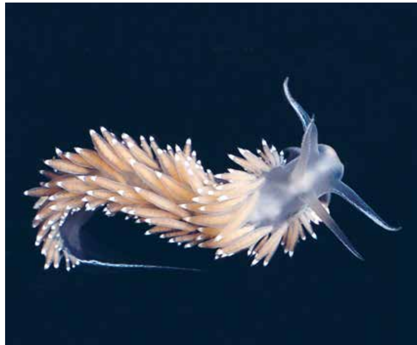
Billedforedrag med motiver fra Øresund