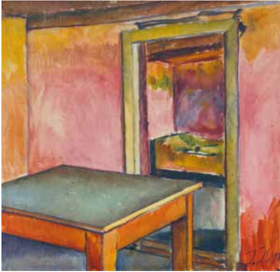
Immanuel Ibsen, Uden titel , u.å. Privateje

Forside: Immanuel Ibsen, Opstilling med appelsiner , 1937, udsnit Statens Museum for Kunst ©SMK Foto