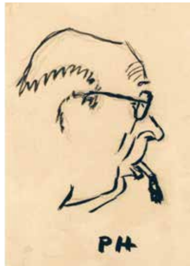
Selvportræt af P.H.

Få udleveret et af museets store puslespil, køb en kop kaffe eller kakao, og du er nu klar til at synke ned i en verden af ro og koncentration. Puslespillet opbevares af museet undervejs og må tages med hjem, når den sidste brik er lagt. Arrangementet er gratis