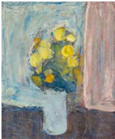
Immanuel Ibsen, Opstilling med gule blomster , ca. 1940. Museum Salling, Kunst. ©Poul Hansen