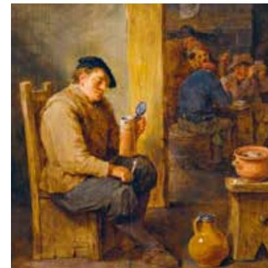
David Teniers II, Det tomte krus , 1668, (udsnit) Nivaagaards Malerisamling

Nivås spejdere 'De Vilde Svaner' sælger juletræer på museets parkeringsplads