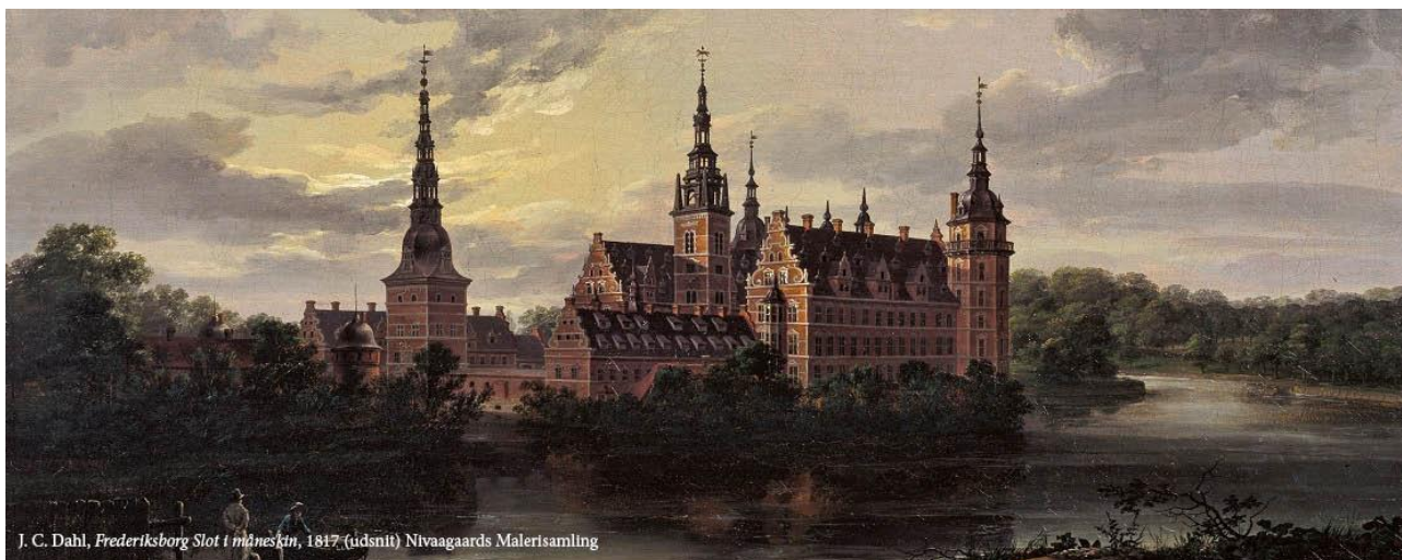
J. C. Dahl, Frederiksborg Slot i måneskin, 1817 (udsnit) Nivaagaards Malerisamling