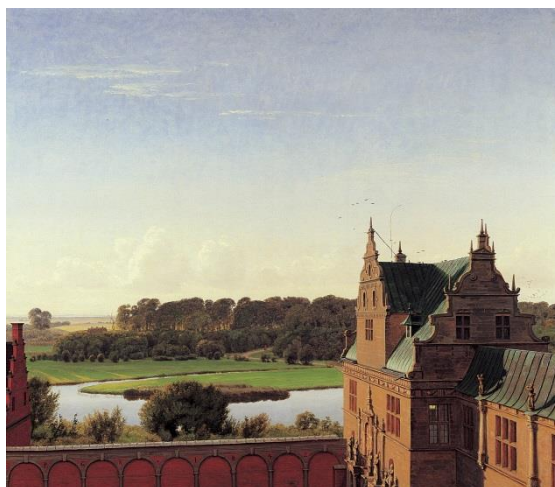
P.C. Skovgaard, Udsigt fra Frederiksborg slot, 1842 Ordrupgaard.

Hele 26 værker fra Ordrupgaards samling af dansk guldalder gæstede efterår 2017 Nivaagaards Malerisamling. De to guldaldersamlinger mødtes i en fælles særøphængning, som udgjorde en fornem præsentation af C.W. Eckersberg, Christen Købke, J. Th. Lundbye, Wilhelm Marstrand, P.C. Skovgaard, m.fl. Der er mange forbindelser mellem værkerne i de to samlinger, som supplerer hinanden på bedste vis, og udstillingen gav et fremragende indblik i en vigtig periode i dansk kunst.