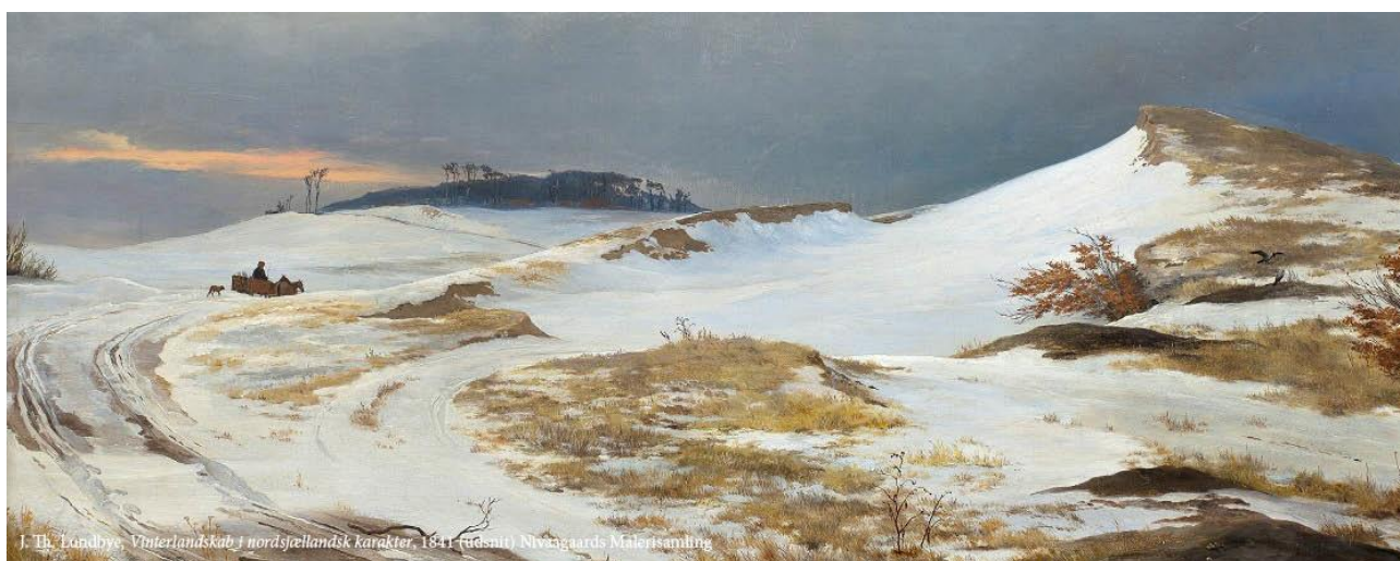
J. Th. Lundbye, Vinterlandskab i nordstjellandsk karakter, 1841 (udsnit) Nivaagaards Malerisamling