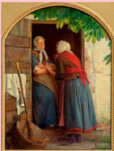
Carl Bloch To koner, der taler sammen, 1874