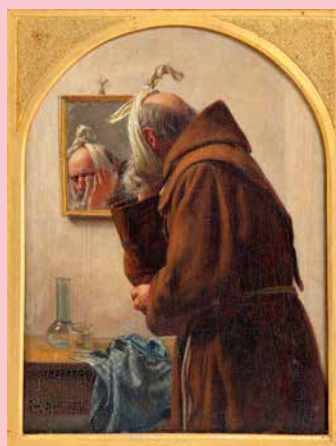
Carl Bloch En munk, der spejler sig, 1875

Et godt råd! Inden I går i gang med skriveopgaven, så kig rigtig godt på jeres maleri. Snak i gruppen om, hvad jeres historie skal handle om og udvælg en person fra gruppen, som skriver historien ned. Husk at arbejde sammen om denne her opgave.