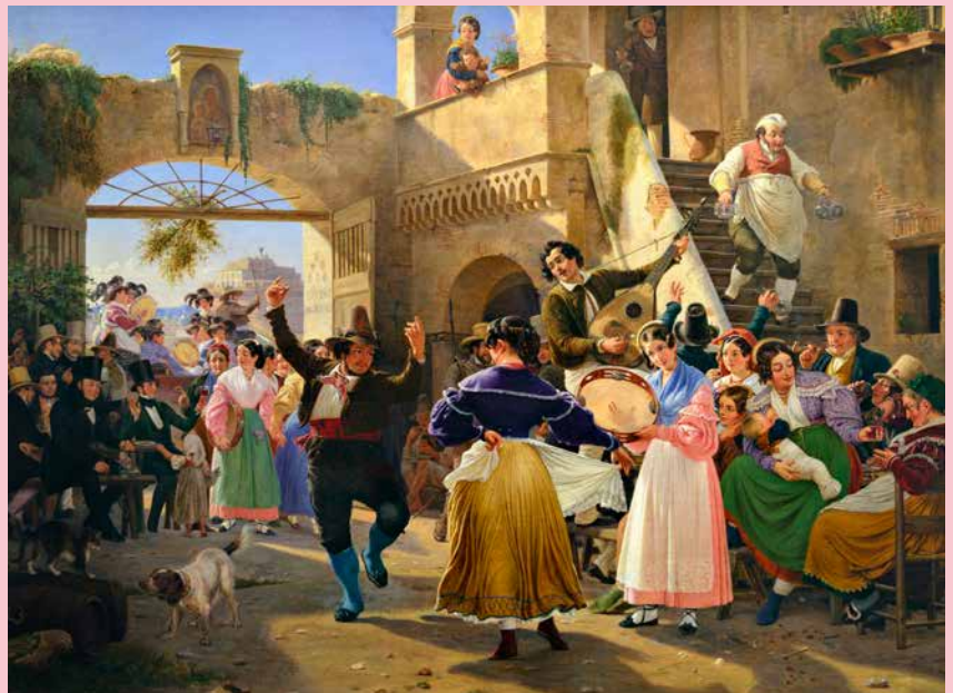
Wilhelm Marstrand Romerske borgere forsamlede til lystighed i et osteri, 1839