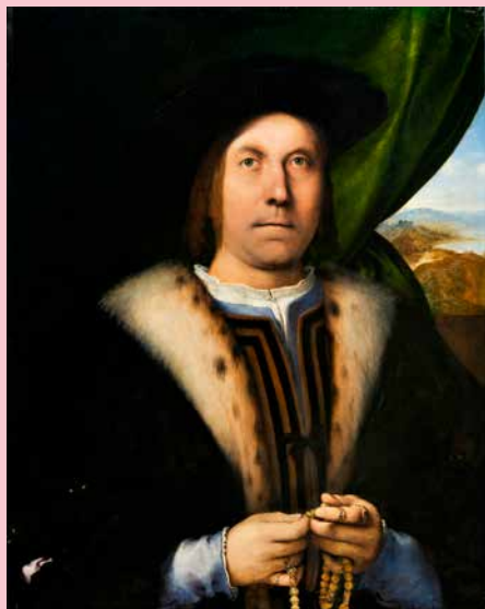
Lorenzo Lotto Portræt af en mand med rosenkrans, ca. 1520