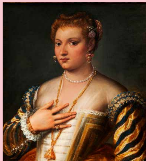
Francesco Montemezzano Portræt af en ung venezianerinde, u.å