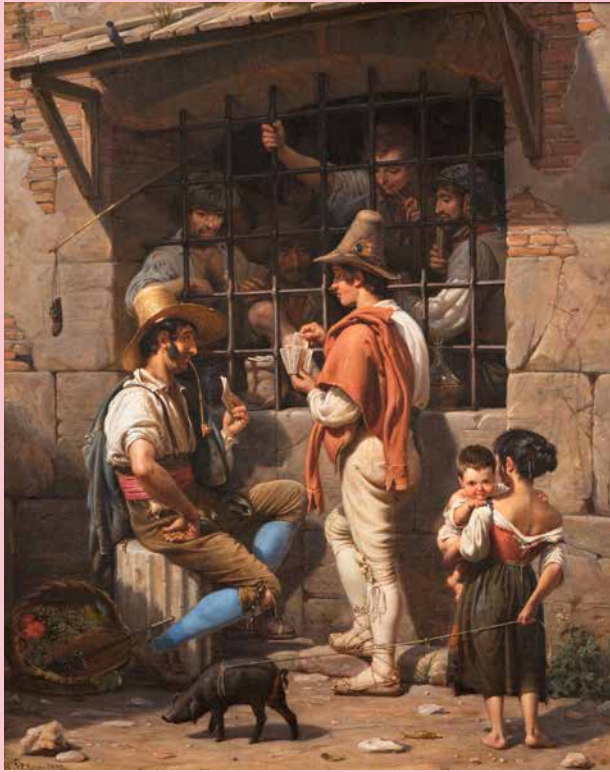
Wilhelm Marstrand En fængselsscene i Rom, 1837