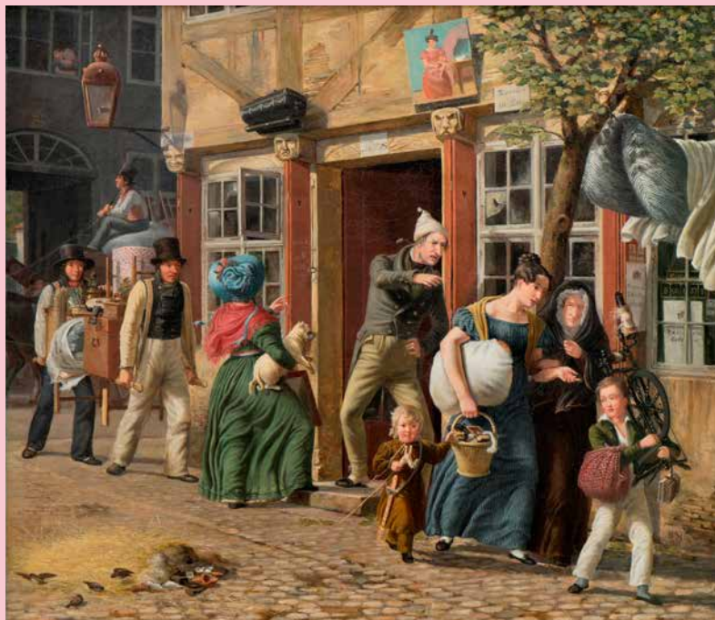
Wilhelm Marstrand En flyttedagsscene, 1831