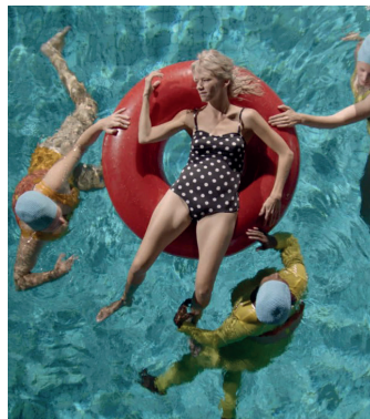
Kortfilmen 'Aqua Mamas' og instruktør Zara Zerny

Til 'Historier om Mødre' og fast samling. 30 min. Gratis for årskortholdere eller når entreen er betalt.